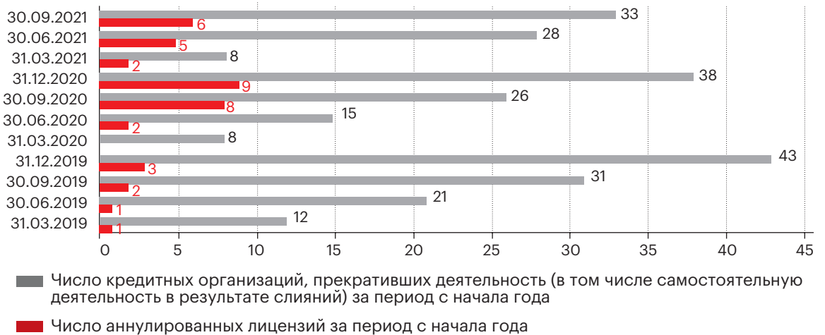
График 2. Число кредитных организаций, прекративших самостоятельную деятельность (накопленным итогом с начала года)