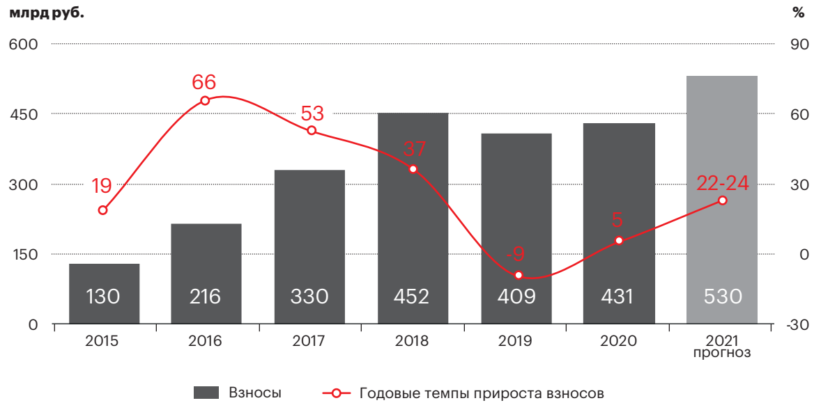
График 4. Прогноз динамики страхования жизни млрд руб.