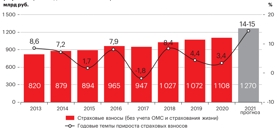
График 3. Прогноз динамики non-life-страхования млрд руб.