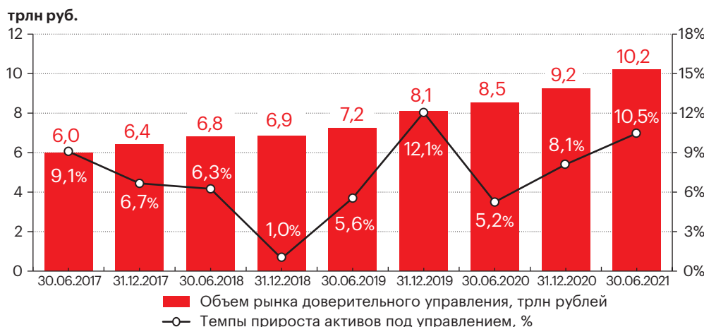
График 1. По итогам 1-го полугодия 2021 года рынок ДУ и коллективных инвестиций достиг 10,2 трлн рублей

Рынок ДУ и коллективных инвестиций за 1-е полугодие 2021 года вырос на 10,5%, до 10,2 трлн рублей активов в управлении, по оценкам рейтингового агентства «Эксперт РА». В I квартале прирост объема активов составил 4,8%, при этом еще более существенная динамика наблюдалась в II квартале, когда рынок ДУ и коллективных инвестиций продемонстрировал максимальную за последние шесть кварталов прибавку в 5,5%. Этому способствовали как притоки новых средств, так и позитивные тенденции на отечественном и мировом фондовых рынках.