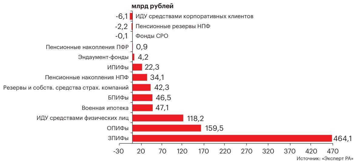
График 2. Абсолютные значения прироста средств по сегментам за 1-е полугодие 2021 года

Совокупно ОПИФы, БПИФы и ИПИФы прибавили 228 млрд рублей, а суммарный объем активов в этих фондах впервые превысил отметку в 1 трлн рублей. При этом стоимость чистых активов собственных ОПИФов, ИПИФов, БПИФов, выкупленных управляющими компаниями в рамках конструирования стратегий доверительного управления, составила на конец II квартала 2021 года 232 млрд рублей.