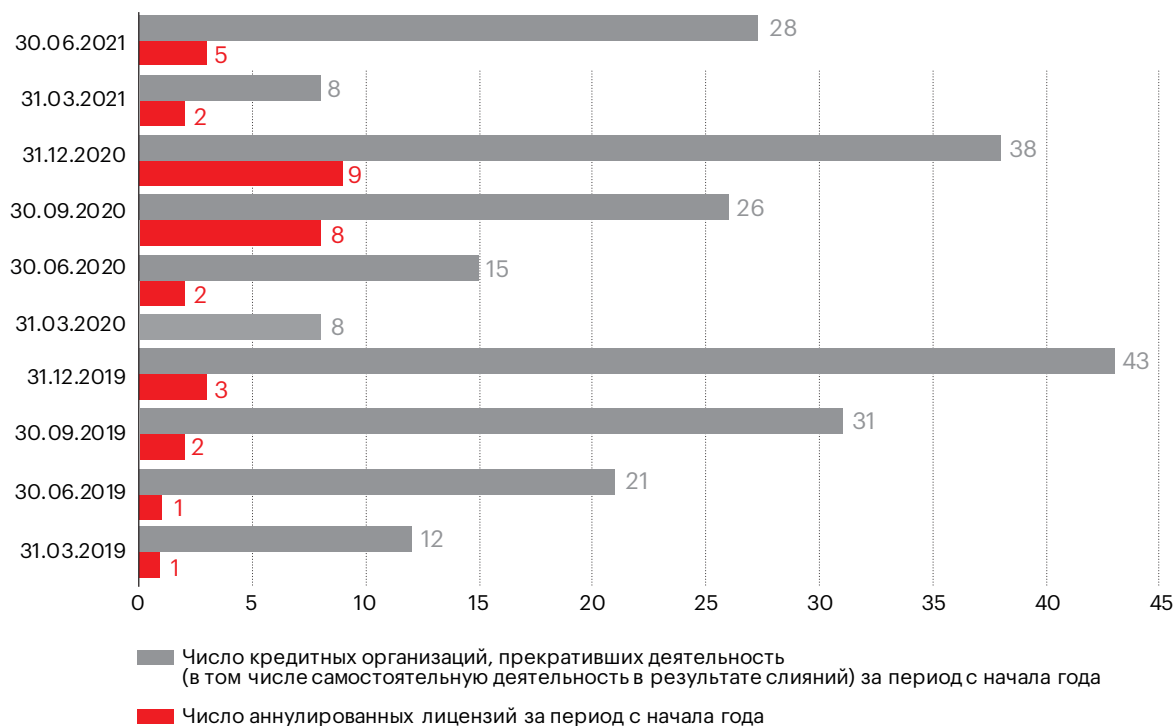
График 2. Число кредитных организаций, прекративших самостоятельную деятельность (накопленным итогом с начала года)