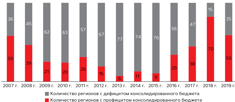
График 1. Количество профицитных регионов соответствует уровню докризисного 2007 года

Агрегированный профицит региональных бюджетов составил 5 млрд рублей по итогам 2019-го против 510 млрд рублей годом ранее. Один из основных факторов снижения размера профицита связан с высокой расчетной базой 2018 года по доходам (рост доходов составил 15,2% к уровню 2017-го). Результаты высокой сбалансированности 2018 года были обеспечены ростом налоговых и неналоговых доходов (далее – ННД), это было преимущественно обусловлено благоприятной внешней конъюнктурой, что в том числе поддерживало высокие цены на сырье, а также динамикой валютного курса рубля. Помимо этого, в прошлом году наблюдался высокий уровень трансфертов из федерального бюджета, в частности, наибольший рост пришелся на дотации на обеспечение сбалансированности бюджетов.