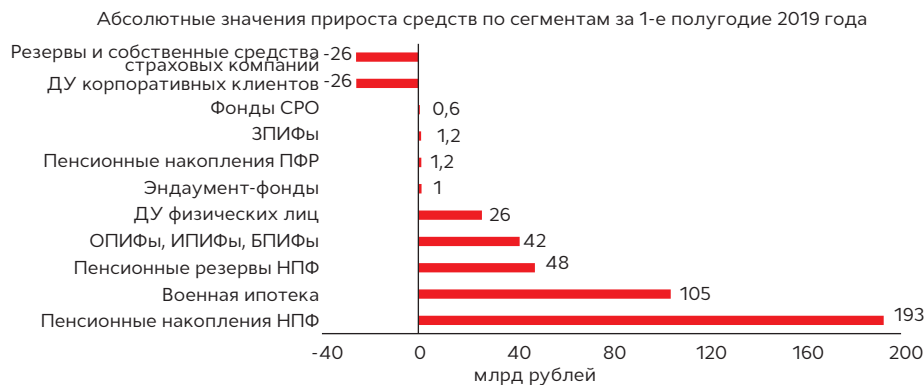
График 2. 1- 2019