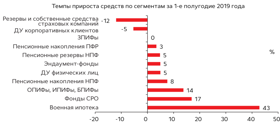
График 3. 1- 2019