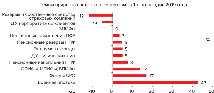
График 3. В 1-м полугодии 2019 года лидерами прироста в относительном выражении стали средства военной ипотеки