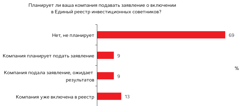
График 4. Около трети УК заинтересованы в деятельности в качестве инвестиционных советников