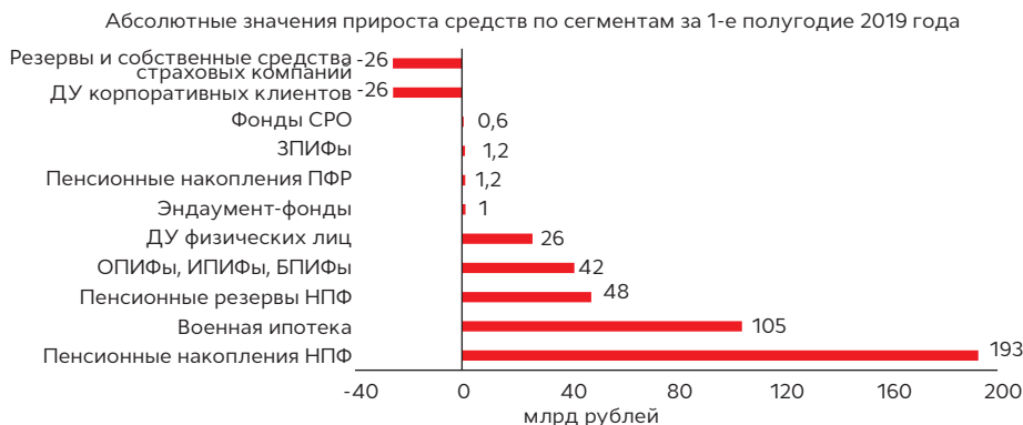
График 2. В 1-м полугодии 2019 года объем рынка ДУ увеличился преимущественно за счет пенсионных накоплений НПФ и средств военной ипотеки