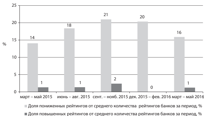
График 1. В марте – мае 2016 года отношение числа снижений рейтингов банков к среднему количеству банков, получивших рейтинг RAEX, заметно сократилось