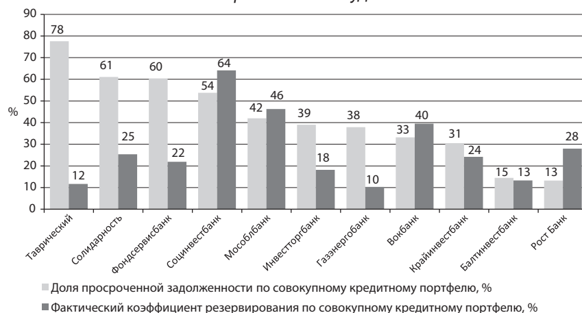
График 3. В среднем для санлируемых банков характерен низкий уровень резервирования проблемных ссуд