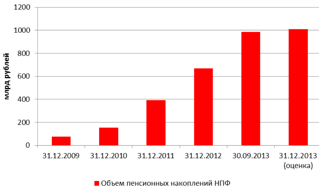
График 1. По предварительной оценке «Эксперт РА», на конец 2013 года объем пенсионных накоплений НПФ составил 1 трлн рублей

В конце 2013 года был утвержден новый порядок регулирования пенсионного рынка. Основной угрозой развития рынка оказалась не ожидаемая проверка фондов со стороны ЦБ и требование об акционировании, а отмена трансферагентских соглашений между НПФ и ПФР. Эта отмена сводит практически к нулю возможности фондов по привлечению 2 трлн рублей пенсионных накоплений «молчунов» из ПФР. С другой стороны, эта отмена закрепит статус-кво между НПФ в распоряжении 1 трлн рублей пенсионных накоплений, который уже есть на рынке.